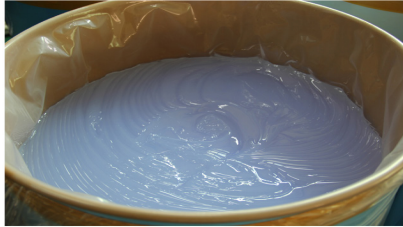
zselés halmazállapotú szilikongumi

Az ipar számos területén bizonyította kiváló tulajdonságait, ezért az elektronikai iparban szigetelőanyagként, fülhallgatókhoz, hallókészülékekhez, az építő- és gépiparban tömítésként, vízzáró elemek készítésére, szellőzőrendszerek, lengés és rezgéscsillapító elemek gyártására, az egészségügyben lélegeztető gépekhez, membránokhoz használják, de a katéterek, csövek, egészségügyi maszkok, gyermek cumik, speciális kesztyűk is szilikonból készülnek.